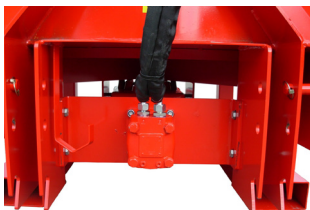
Commande par moteur hydraulique de l'entraînement du boîtier débit 80 L/min en remplacement de la transmission • ML160H pour une charge de mélange < 2000 kg • ML315H : une charge de mélange > 2000 kg