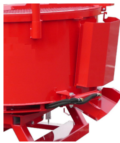
MH200T : Commande par l'hydraulique tracteur du vérin D.E. d'ouverture et de fermeture de la trappe de vidange