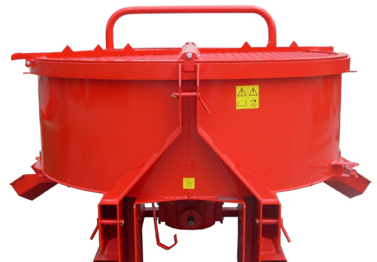
MT-SUP : Trappes de vidange supplémentaires soit au total 3 au maximum : - 1 à droite d'origine - 1 à gauche optionnelle - 1 à l'arrière optionnelle.